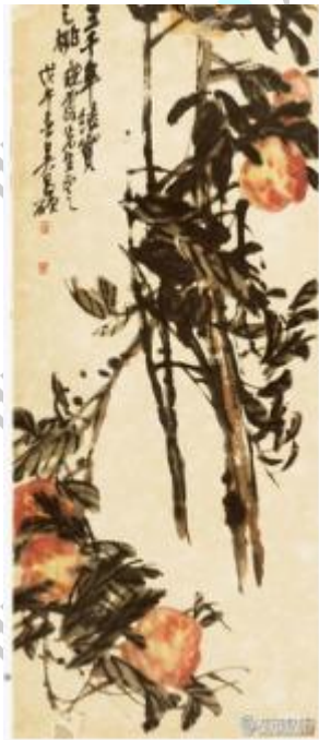
图 1 《三千年结实之桃》